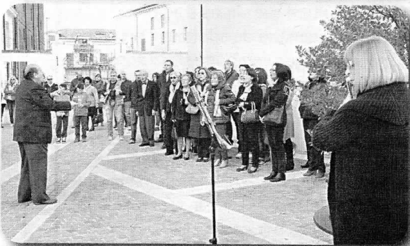
Il flash mob in piazza

scoraggiato, ma in ogni sua opera è presente una fortissima componente religiosa. Cercheremo di renderle al massimo delle nostre potenzialità, grazie anche agli strumenti dei Virtuosi Laurenziani e alle voci soliste che ci accompagnano".