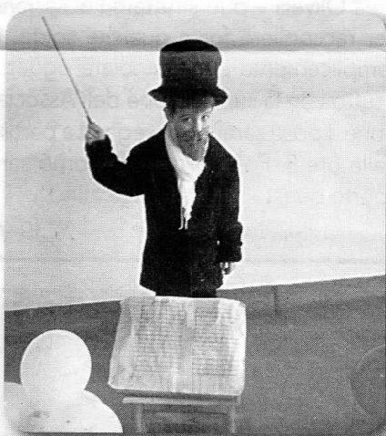
Alcuni momenti dello spettacolo dedicato a Giuseppe Verdi

In occasione del bicentenario della nascita di Giuseppe Verdi molte sono le iniziative culturali che si svolgono in tutta Italia. La scuola elementare dell'Istituto Comprensivo Statale di Mortara, in collaborazione con la scuola materna ha deciso di festeggiare il compleanno del famoso maestro partecipando a una delle diverse ed interessanti manifestazioni nazionali. Aderendo al progetto promosso da AsliCo e da OperaEducation.org, alcuni alunni delle sezioni III, IV e V si sono ritrovati giovedì mattina per cantare tutti insieme il "Va Pensiero" tratto dal Nabucco, accompagnati dalle coreografie dei bimbi della scuola materna, vestiti a tema. Il video girato durante la mattinata è stato poi inviato al sito di Operaeducation e sarà presto visualizzabile insieme a quelli delle altre scuole, una trentina, che hanno deciso di partecipare all'iniziativa, con lo scopo di avvicinare i bambini alla cultura e alla musica in modo divertente e costruttivo. (c.m.)