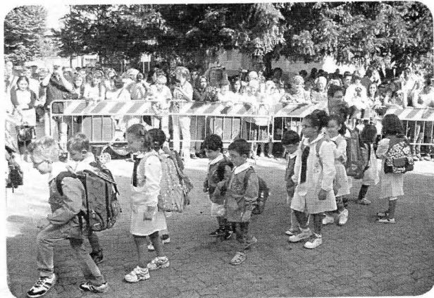
L'accoglienza dei "remigini"