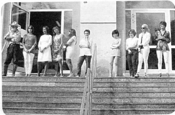
Le insegnanti della scuola primaria